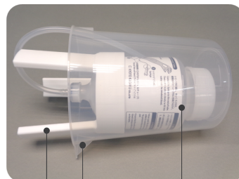
模擬血液用 ボトル設置台 ディスプレイポカッ