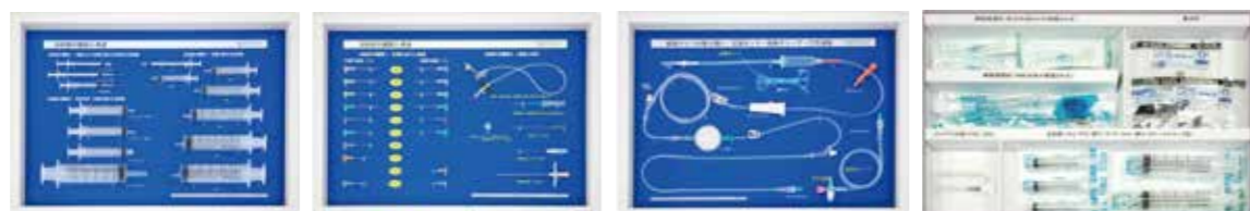
No.1 シリンジの種類と名称 No.2 注射針の種類と用途 No.3 輸液ラインの取り扱い方 No.4 注射針 性能を確認できるセット

MY-5 12022-500 ¥121,000 (税別¥110,000) 臨床で使用されている注射器や注射針、輸液ライン等の器具を実習時の事前学習用にセットしました。