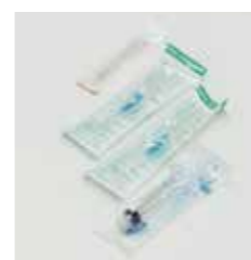
(写真手前から) シリンジ/静脈留置針/注射針