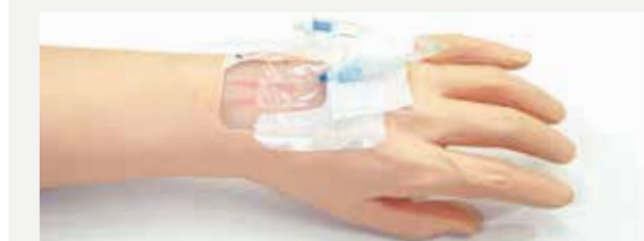
静脈留置針の固定