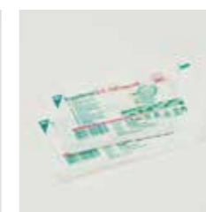
フィルムドレッシング