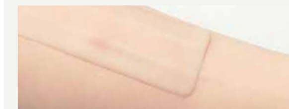
血管の怒張を表現