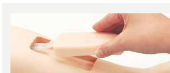
パッド交換が簡単