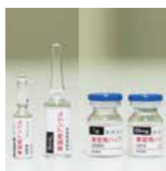
実習用アンプル・バイアル