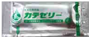
骨盤臓器脱(子宮脱)モデル 専用潤滑剤 5個組

・その他ご不明な点がございましたら、お買い上げの販売店もしくは、株式会社京都科学までお問い合わせください。