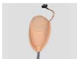
筋肉部 (センサー内蔵)