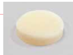
交換用注射パッド