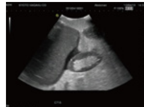
肝臓 / 腎臓部（右上腹部出血）