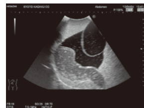
膀胱部（骨腸部出血）