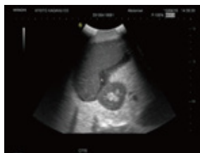
脾臓 / 腎臓部（左上腹部出血）