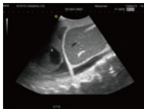
心臓部（心タンポナーデ）