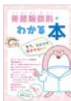
啓蒙を目的とした小冊子が付属します