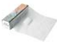
マネキン フェイスシールド

マネキンフェイスシールド (15120103) 11218-030 6ロール入 ¥22,500(税別) (1ロールは36人分です)