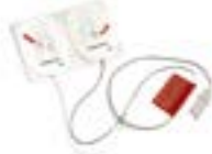
標準トレーニング パッド

標準トレーニングパッド (198-80550) 11360-020 1組 ¥6,000(税別) 11360-021 10組 ¥48,000(税別)