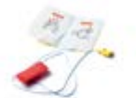
レールダル リンク トレーニングパッド

レールダル リンクトレーニング パッド 1組(945090) 11246-030 1組 ¥6,300(税別) 11360-011 10組 ¥50,400(税別) AEDレサシアンQCPR、 AEDリトルアン用